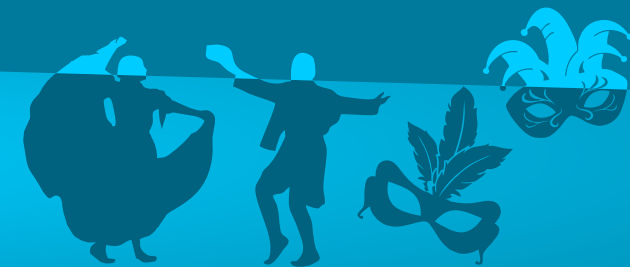
Tabla N°1. Inversión 46° Festival Folclórico Colombiano